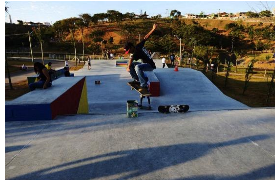
Parque Municipal Luciano do Valle, na Vila União