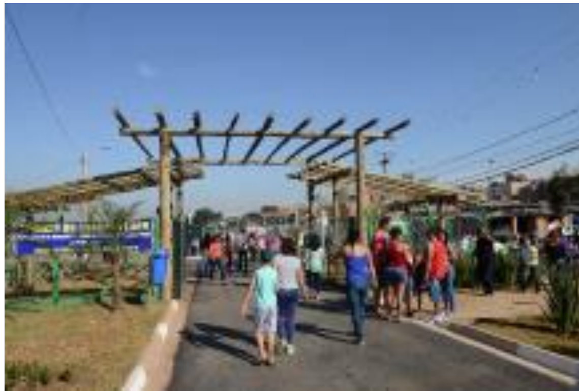
Parque Municipal Dom Bosco, no Bairro Vida Nova

Duas grandes áreas carentes da cidade, que antes não tinham nenhuma opção de lazer, hoje contam com 2 importantes parques.