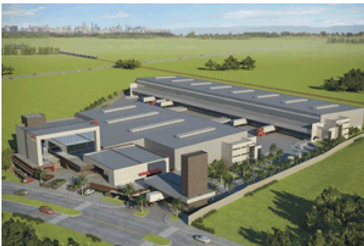
Projeto da fábrica BYD, em Campinas

BYD, empresa chinesa especialista em veículos híbridos e elétricos, traz 600 novos empregos e faz Campinas ser a pioneira em frota de táxis elétricos. A empresa também prevê a produção de 10 ônibus elétricos na cidade.